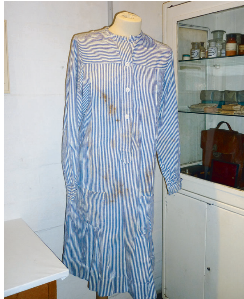
Unvollständig: Das im Bunker-museum ausgestellte Kleid einer Rot-Kreuz-Schwester. Es fehlen der Kragen, die Schürze und die Haube.

nicht als Rot-Kreuz-Schwester Dienst tat, arbeitete als Luftwaffenhelferin, Eisenbahnschaffnerin, bediente die Scheinwerfer der Flugabwehrgeschütze oder war in einer Munitionsfabrik beschäftigt.