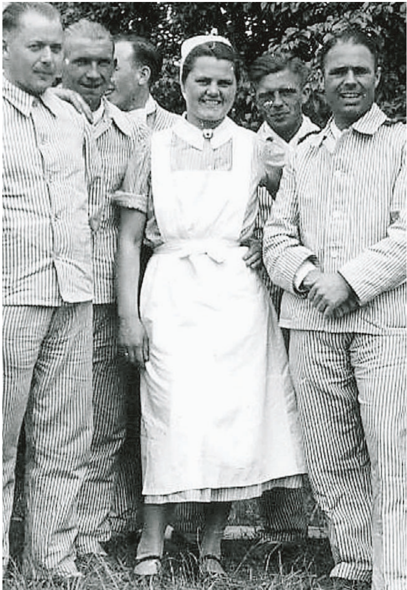
Aus der Bildersammlung des Bunker-museums: Eine Krankenschwester im Krieg; neben ihr stehen mehrere mit Schlafanzügen bekleidete Patienten, bei denen es sich um Soldaten handelt.

wesen. Kurz vor Kriegsende 1945 überlegte das nationalsozialistische Regime noch, ob und wie man die vielen Tausend Frauen im Kriegsdienst in „Wehrmachtshelferinnen-korps“ zusammenfassen könnte. Dazu kam es nicht mehr. In Ostfriesland war der Krieg am 3. Mai 1945 zu Ende. Emden war durch die vielen Luftangriffe dem Erdboden gleichgemacht worden. Nun brauchte man „Trümmerfrauen“, um die Schuttmassen zu beseitigen und die Stadt wieder aufzubauen.