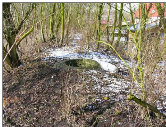
Tobrukstand Amselstraße, eingedet