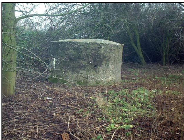
Tobrukstand Frisastraße, Aufnahme Dietrich Janßen, Emden