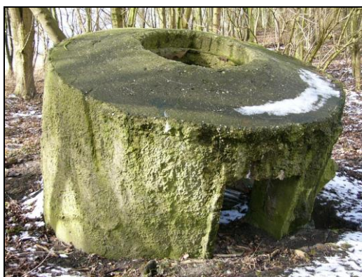
Tobrukstand Frisadeich hinter dem Klärwerk Larrelt