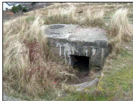
Die Tobrukstellung in den Dünen von Den Helder war erdversenkt, lediglich zum Eingang führten Stufen hinab. Heute ist dieser Ringstand Regelbau 58c unter dem Sand beinahe begraben.

Auch in Emden wurden im Jahre 1944 zur Rundumverteidigung der späteren Festung Emden kleinere betonierete Tobrukstände in die Deiche und an Kanalböschungen des Ems-Jade-Kanals (im Rahmen des Ausbaues des Friesenwalls) eingebaut. Am 30. September 1944 waren Heinrich Himmler und der Gauleiter Paul Wegener, die Organisation Todt, Vertreter der Partei und weitere zivile Behörden beim Oberbürgermeister Carl Renken in Emden, um über die Verteidigungsmaßnahmen der Stadt zu sprechen. Zum Abschluss der Besprechung wurde u.a. ein Tobrukstand nördlich der Knock besichtigt. 4 Weitere Erdverteidigungsstellungen wurden in der nachfolgenden Zeit um Emden herum errichtet, wie Luftaufnahmen vom 1. Januar 1945 der alliierten Luftaufklärung zeigen. Nördlich des Conrebbersweges sind deutlich die unbesetzten Stellungen zu erkennen. Zwei dieser Stellungen befanden sich auch in der Nähe zum Friedhof Nesserland hinter dem ehemaligen Schlafdeich an der heutigen Frisiastraße/Ecke Fritz-Liebsch-Straße (östlich und westlich auf dem Grundstück der Score-Tankstelle). Auch ist dort ein abgewinkelter Schützengraben in der Schneelandschaft erkennbar. Weitere 12 Stellungen wurden auf den Luftaufnahmen vom 1. Januar 1945 gezählt. Davon allein am Conrebbersweg zehn Anlagen.